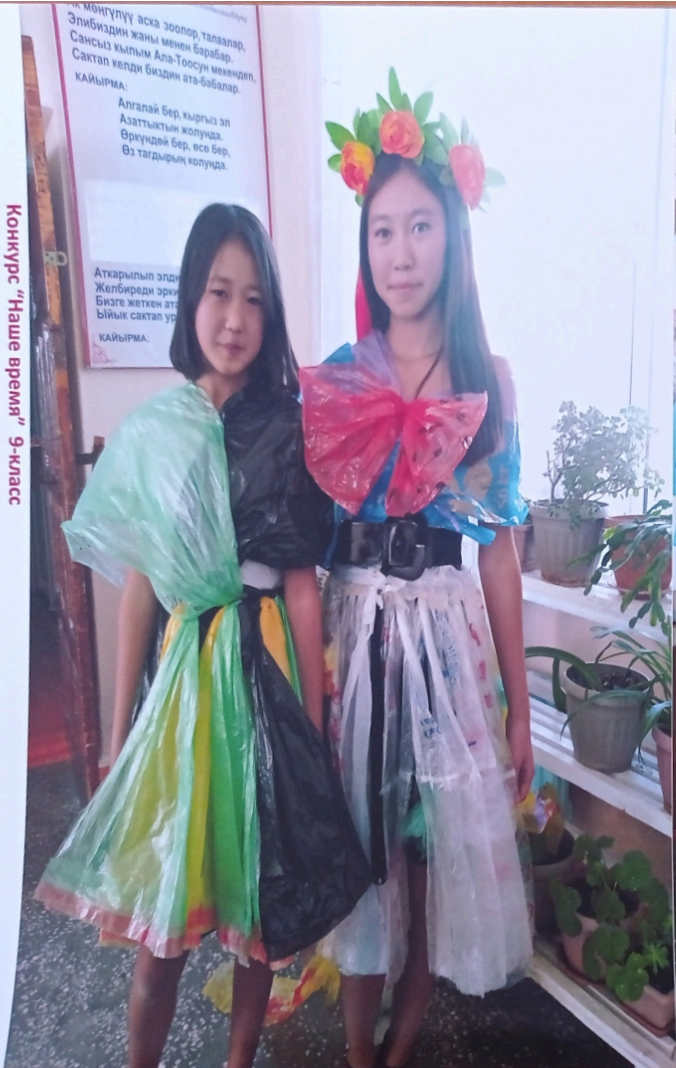
Конкурс "Наше время" 9-класс