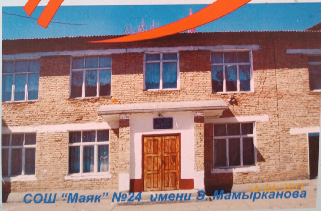
СОШ "Маяк" №24 имени Э. Мамырканова