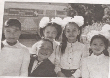
Учащиеся 4 класса, школы им. В. Ленина, г. Баткен

В Таблице 1 представлены основные параметры проведения исходной оценки, а в Таблице 2 и 3 – разделы тестов, а также примерные задания. После этого в статье представлены основные результаты учащихся (сильные и слабые навыки), с разбивкой по полу учащихся, классам обучения, городским и сельским школам.