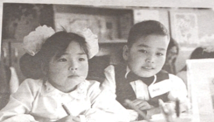
Учащиеся 2го класса, средней школы с. Полтавка, Жайылский район, Чуйская область

Учащиеся вторых классов показали относительно высокие результаты по следующему фундаментальным математическим навыкам: